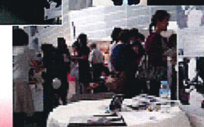
smile women festa