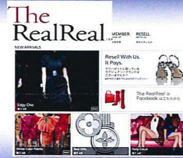
ザ・リアルリアル 日本サイト

日本メンタルヘルス協会 公認心理カウンセラー 株式会社梶井利依事務所 代表取締役 女性限定セミナー 「ポリッシュナビ!」主宰