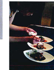
デジタル料理BOOK 監修&撮影