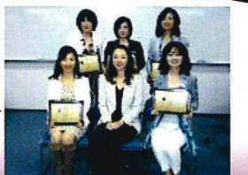
認定授与式後の撮影