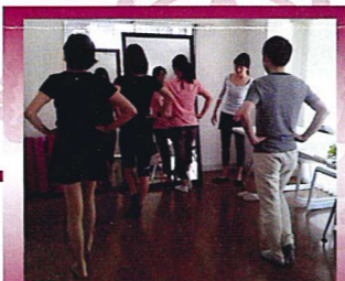
骨盤ウォーキング&ストレッチ

Kindleにてデジタルブック『ファッションマイスター検定3級問題集』を発売 部門別 月間ランキング2位獲得！