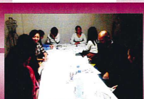
ビフォーアフターセミナー

6日 大阪・梅田グランフロントナレッジ 31日 iPadを使用したスタイリング提案に協会スタッフが参加