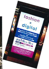
@グランフロントナレッジキャピタル