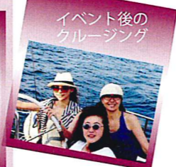
イベント後のクルージング