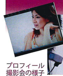
プロフィール撮影会の様子