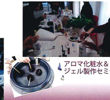
アロマ化粧水&ジェル製作セミナー