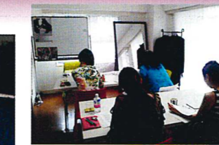
有資格者研修の様子