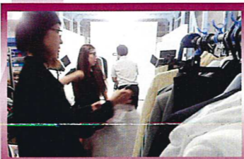
DICE撮影のスタイリング現場

7日 外資系企業イベントにおいて 協会スタイリストがワークショップを開催 600名を対象に実施