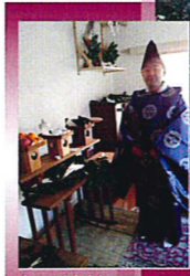
氷川神社、神主による神事