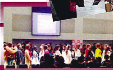
名古屋モデルコレクション