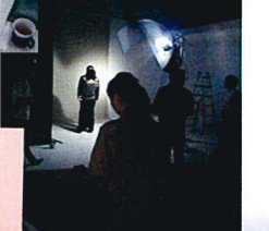
メンバーによる撮影アシスタント